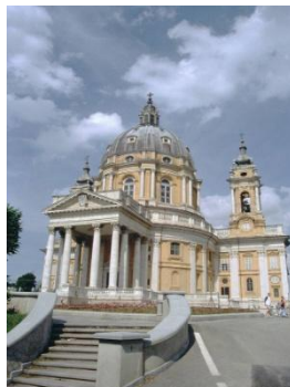
Santuario di Superga