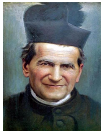
San Giovanni Bosco