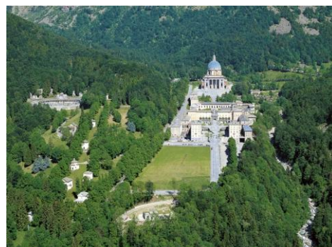
Santuario di Oropa